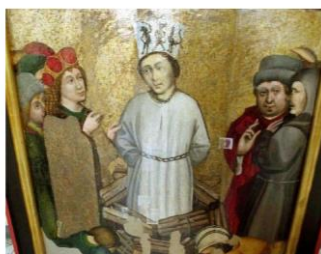
gotický oltář z kostela sv. Václava v Roudníkách