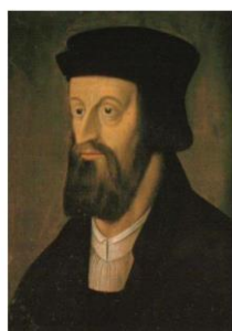
neznámý malíř z 16. století