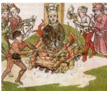
Ulrich Richenthal (Kronika kostnického koncilu)

Porovnejte, jak se měnily portréty Jana Husa.